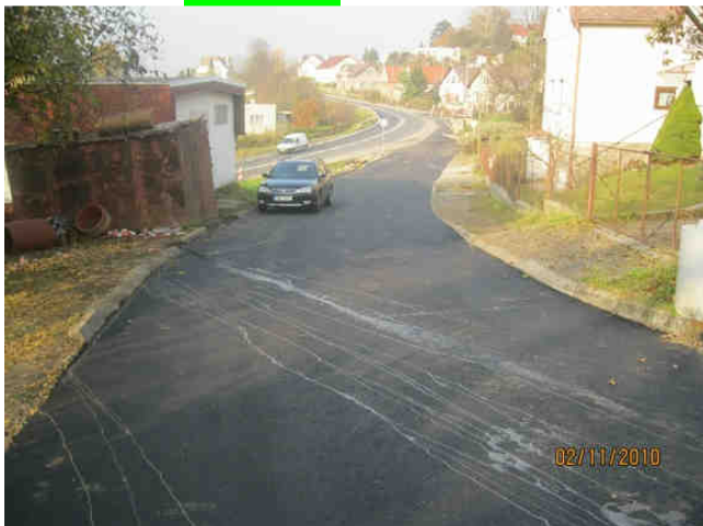
Afaltování Třešňová ulice - 1