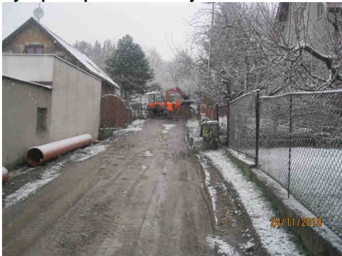
Výkopové práce Valdštejská ulice