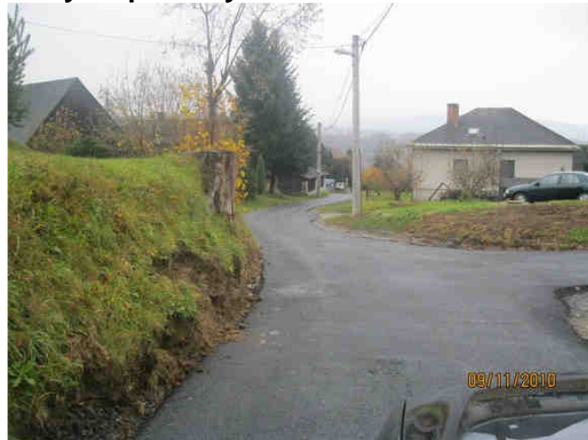
Kobylka povrchy - 2