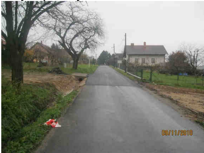
Kobylka povrchy - 1