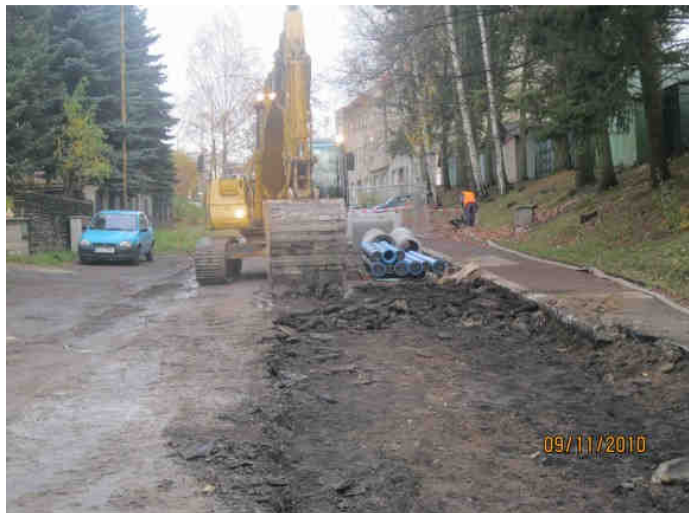
Pohled směr nemocnice