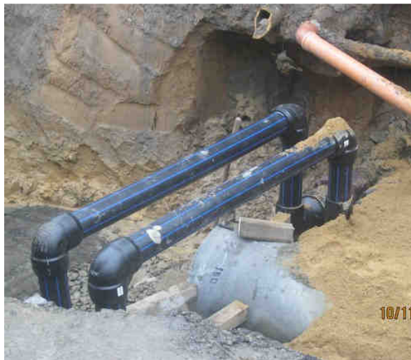
Řešení v místě konfliktu