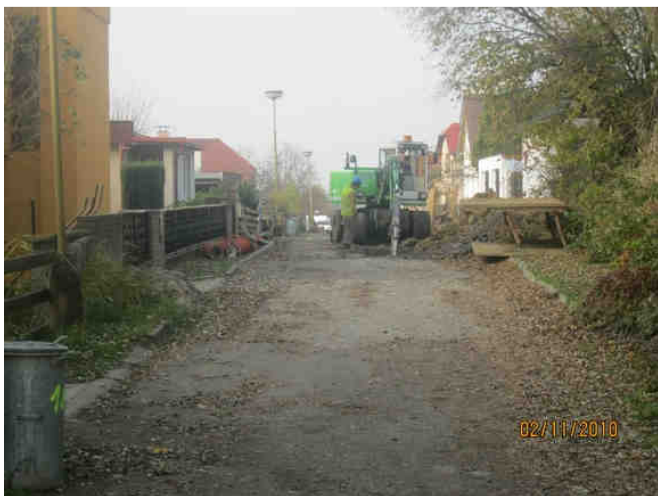
Výkopové práce na konci ulice Třešňová u domu 1867