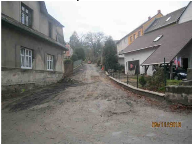
Hruboskalská – spodní část