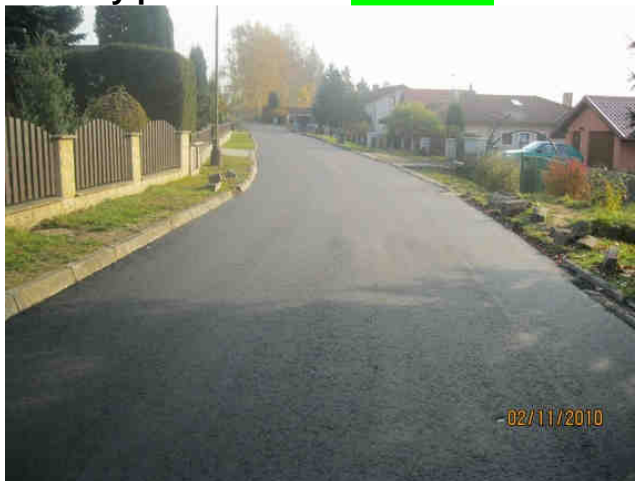
Celkový pohled v ulici Třešňová - 2