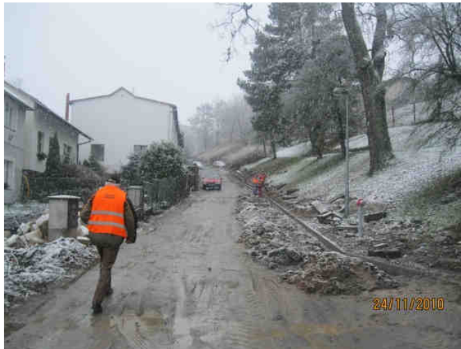
Hruboskalská – horní část