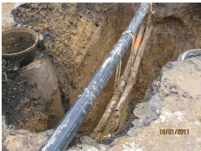
Situace ve výkopu