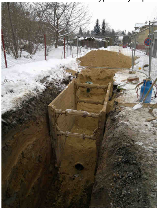
Pažení a zásyp ve výkopu