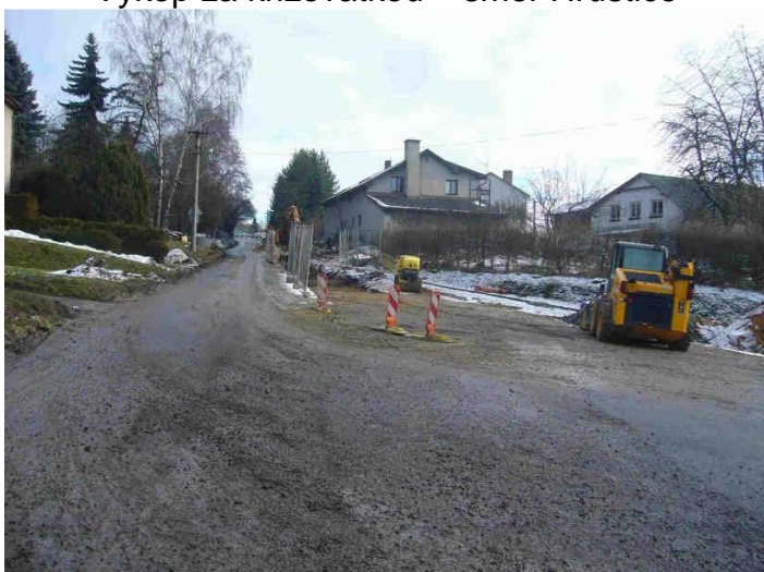
Výkop za křižovatkou – směr Hrušnice