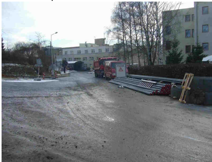
Dopravní situace u nemocnice