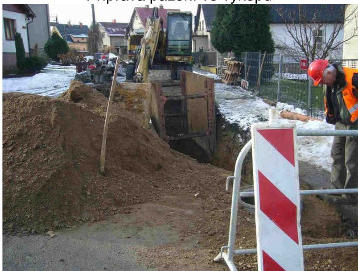
Příprava pažení ve výkopu