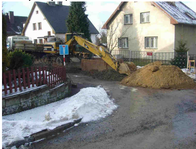
Zahájení výkopu v Karla Vika u Lidické ulice