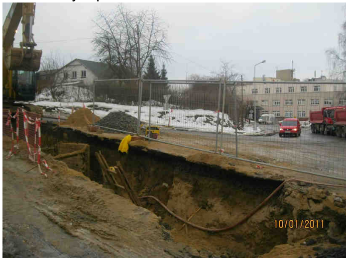
Výkop v křižovatce u nemocnice