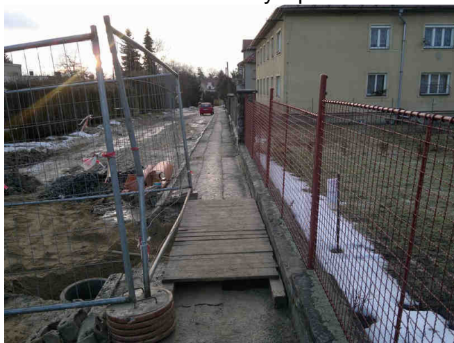
Přechod nad výkopem