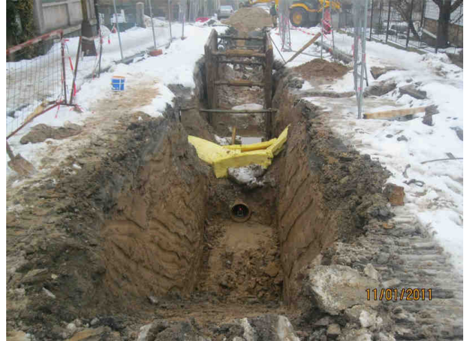
Celkový pohled v ulici na výkop