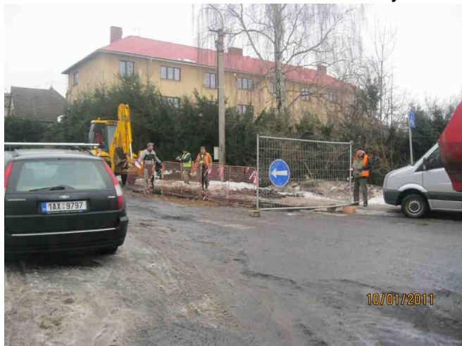
Pohled v křižovatce s Žižkovou ul. u bytovek