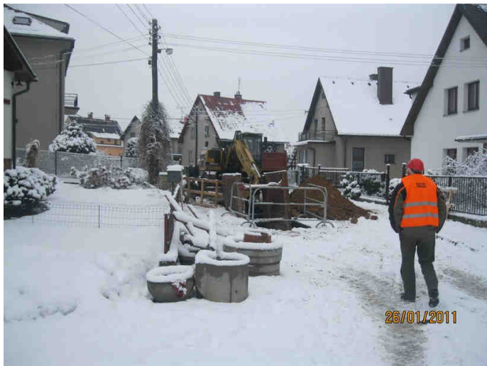
Pohled do ulice